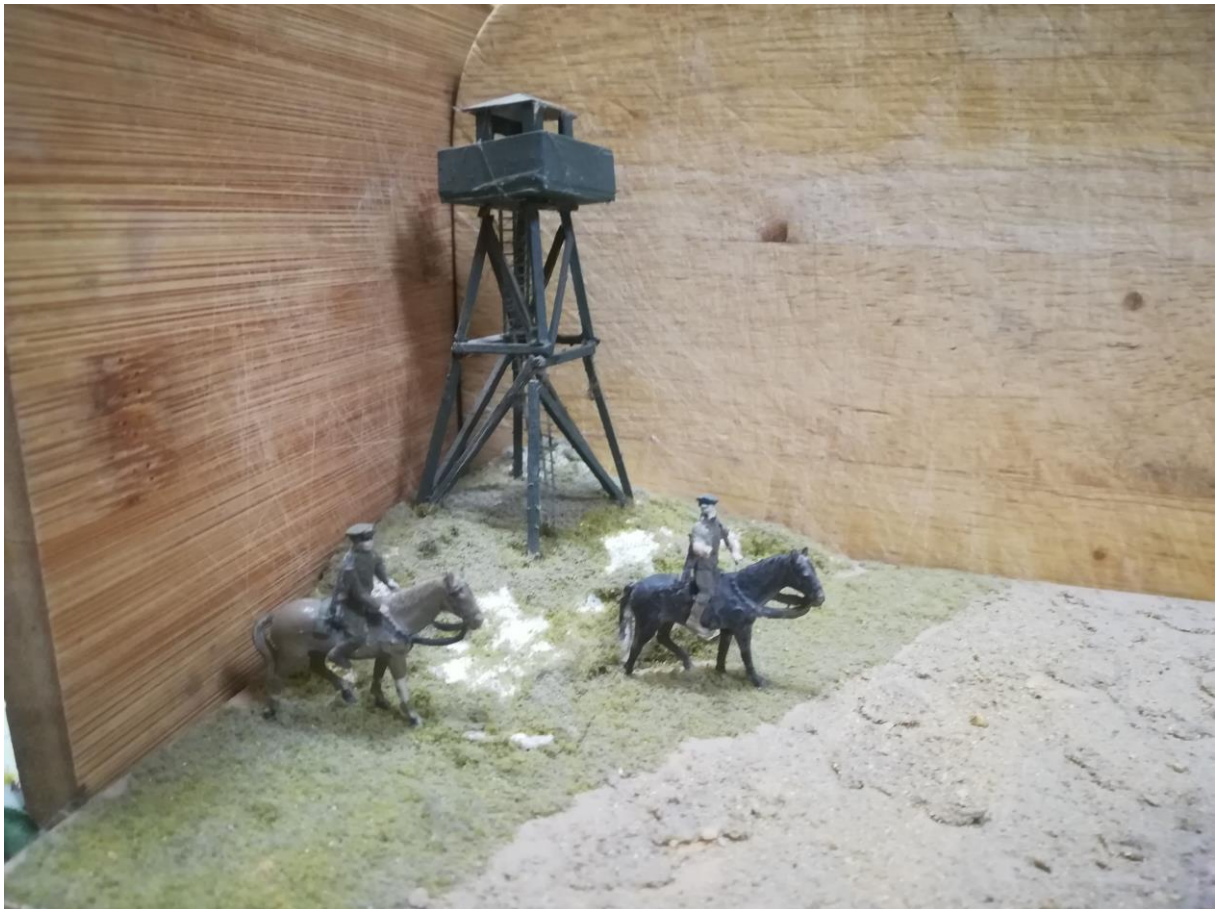
1. ábra A gyalogló kozákokból lett magyar lovasjárőr...

Nem sokkal az első határőr-dioráma elkészülte után hozta a posta az Esci "oroszkatonák" figuráit. A készlet lovakat is tartalmazott. Lovast viszont egyet sem. Két kozák vezette a lovát, teljesen logikátlanul. No, úgy döntöttem, hogy visszaültem a lóra őket. Nem ez volt az egyetlen átalakítás. Magyar határőrökké kellett változtatnom Zaporozsje fiait. Az átalakítás eléggé ijesztően kezdődött. A figurák végtagjait le kellett vágnom. A karokat töből, a lábakat térdben. A fej is lekerült, de csak azért, hogy enyhén elfordítva visszaüljön a nyakakra. A sajátos kozák kucsmára is került egy apró adag Italeri tömítő. Így egész szépen sikerült kialakítanom a határőreink által viselt tányérsapkát. Le kellett faragnom a hosszú zubbony derékszűj alatti, kitüremkedő részét. A géppisztolyokat is ívtárasra vágtam. A két pacinál is figyelni kellett, hogy ne legyenek teljesen egyformák. A nyereg-résznél egész mélyen kellett befaragnom, hogy jól illeszkedjen a lóhoz a lovas eredetileg nem oda tervezett figurája. Amikor már fixen ült, elkészítettem a karokat, kezeket. Az egyikkel illik fogni a szárat. A másik "szabadon választott". Amikor elkészültek, részint az eredeti figura levágott karjaiból, részint teljesen más figurák karjaiból válogatott darabokból és tömítőanyagból álltak össze.