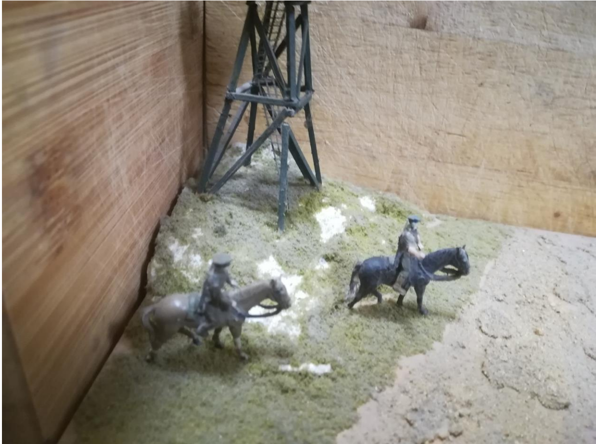
2. ábra ... még egyszer

A lábak kialakításához az eredeti lábakat ragasztottam vissza. A hiányokat tömítőpasztával pótoltam ki. Amikor mindez készen volt, már "csak" le kellett festenem újsütetű határőreimet. Az arcot, kezeket matt fehérbe kevert csepp matt piros, barna és sárga színek keverékével "sminkeltem". Az egyenruha Humbrol 155-tel nyerte el a színét. Az utászcizma szárának színe halványabb, a feje sötétebb színű barna, ez utóbbi csaknem fekete. Sikerült H 30-cal kifestennem a sapka posztószegélyét. A váll-lapokat nehezebb megjelenítenem. Nagyon aprók az amúgy sem túl nagy figura vállain.